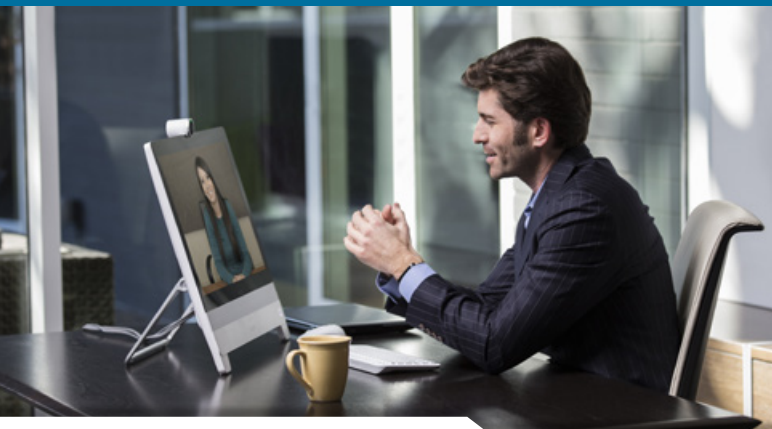
Cisco All-In-One Desktop-Lösung