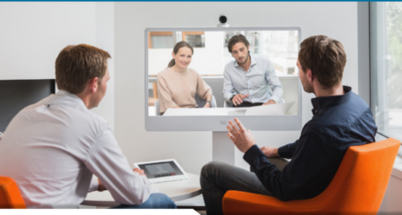
Cisco All-In-One Raum-Lösung für Videokonferenzen